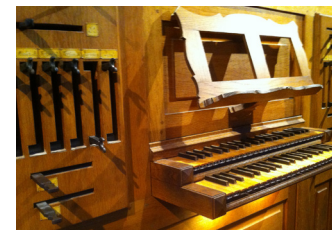
Orgue Marc Garnier, Saint Paul